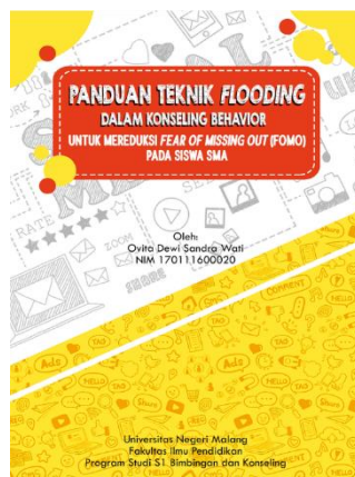
Gambar 4. Cover dalam Buku Panduan Teknik Flooding dalam Konseling Behavior untuk mereduksi Fear of Missing Out Siswa SMA