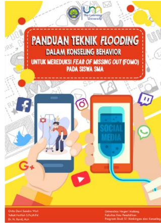
Gambar 2. Cover Depan Buku Panduan Teknik Flooding dalam Konseling Behavior untuk Mereduksi Fear of Missing Out Siswa SMA