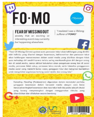
Gambar 3. Cover Belakang Buku Panduan Teknik Flooding Dalam Konseling Behavior untuk Mereduksi Fear of Missing Out Siswa SMA