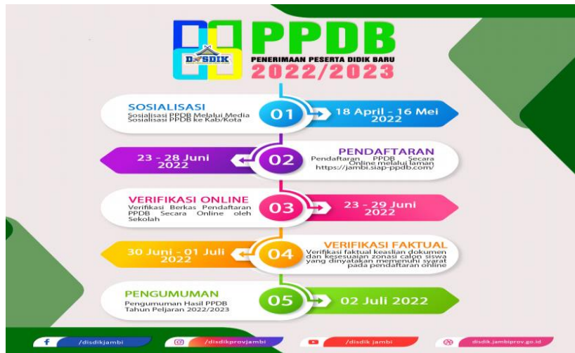
Gambar 1. Informasi Waktu Pelaksanaan PPDB oleh Dinas Pendidikan Prov. Jambi

4.2 sebaran informasi yang diterbitkan oleh Dinas Pendidikan Provinsi Jambi yang menjadi acuan oleh Sekolah Menengah Atas Negeri 1 Muaro Jambi.