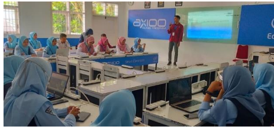
Gambar 3. Kegiatan Pelatihan Digital Entrepreneur Academy (DEA)

Tim SPW juga mengadakan kegiatan lomba kewirausahaan yaitu YEC ( Young Entrepreneur Contest ) yang digunakan untuk membangunkan semangat berwirausaha pada peserta didik dengan diadakan bazar dan presentasi produk yang dihasilkan. Selain itu juga memberikan kelengkapan fasilitas kepada peserta didik seperti wifi, lab komputer, kamera foto, kamera video yang dapat digunakan oleh peserta didik dalam pembuatan konten digital sebagai penunjang peserta didik dalam memperkenalkan produk yang telah dihasilkan yang nantinya akan dipasarkan.