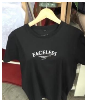
Gambar 2. Hasil Produk SPW dalam Bentuk Desain Jasa Baju

Sedangkan salah satu hasil mengenai produk jasa yang dihasilkan peserta didik pada program SPW dipaparkan pada Gambar 2.