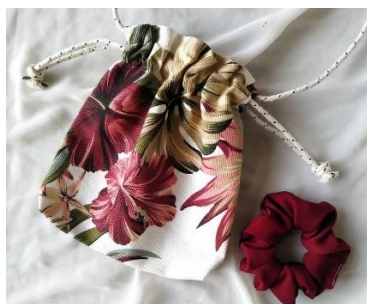
Gambar 1. Hasil Produk SPW dalam Bentuk Barang (Scrunchie)

Salah satu hasil mengenai produk barang yang dihasilkan peserta didik pada program SPW dipaparkan pada Gambar 1.