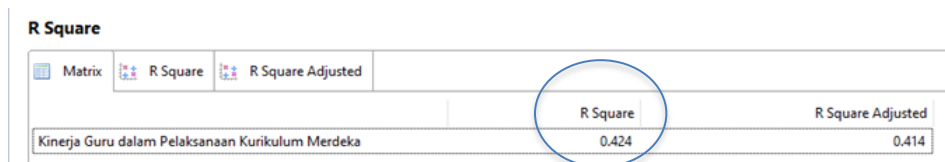
Gambar 4 Uji R-Square

sebesar 42,4% sedangkan sisanya sebesar 57,6% dipengaruhi oleh variabel lainnya diluar penelitian yang dilakukan oleh peneliti. Hal tersebut dapat dilihat pada Gambar 4 sebagai berikut: