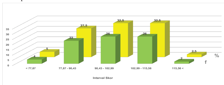
Gambar 1 Distribusi Frekuensi Variabel Pembelajaran Karakter (X)

Berdasarkan hasil perhitungan data variabel pembelajaran karakter (X) diketahui: rerata 96,71; deviasi standar 12,56; skor maksimum 133; dan skor minimum 64. Berdasarkan hasil perhitungan dengan menggunakan rumus stanfive (Tabel 1), diketahui deskripsi frekuensi variabel pembelajaran karakter (X) seperti pada Gambar 1. Berdasarkan pada Gambar 1 diketahui responden yang berada pada skor: < 77,87 sebanyak 4 orang (5%); 77,87 s.d. 90,43 sebanyak 22 orang (27,5%); 90,43 s.d. 102,99 sebanyak 26 orang (32,5%); 102,99 s.d. 115,56 sebanyak 26 orang (32,5%); dan > 115,56 sebanyak 2 orang (2,5%). Mengacu pada rerata (96,71) disimpulkan variabel pembelajaran karakter (X) termasuk dalam kategori cukup baik.