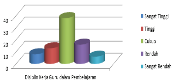
Gambar 2. Diagram Bar Pengkategorian Data Disiplin Kerja Guru dalam Pembelajaran (Y)

Pada variabel Y ini terdapat dua subvariabel, subvariabel 1 yakni peraturan tertulis berada pada kategori tinggi dengan frekuensi sejumlah 34 dan persentasenya yakni 50,7% sedangkan subvariabel 2 yakni peraturan tidak tertulis memiliki frekuensi 27 dengan persentase 40,3% yang berada pada kategori cukup. Pada Tabel 4 dapat dilihat mengenai kategori subvariabel Y.