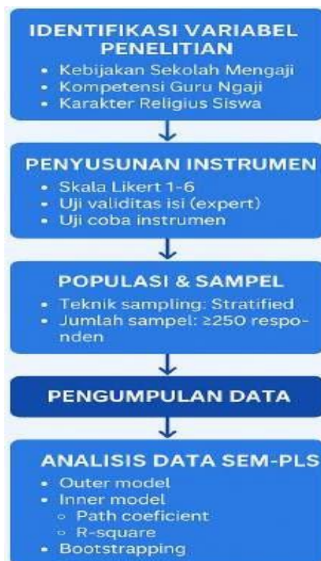
Gambar 1. Prosedur Pengolahan Data

dengan prosedur bootstrapping 5.000 resampling, sedangkan efek mediasi kompetensi guru dianalisis menggunakan Variance Accounted For (VAF). Aspek etika dipenuhi melalui pemberian informasi kepada responden mengenai tujuan penelitian, kerahasiaan data, serta persetujuan partisipasi secara sukarela.