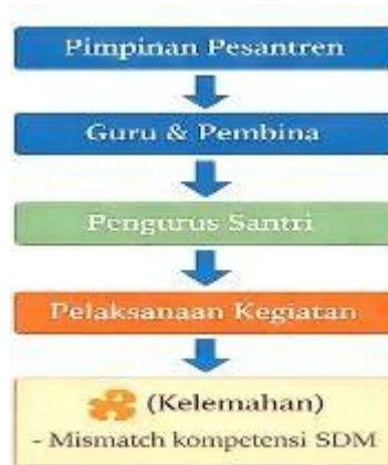
Gambar 3. Pengorganisasian Pengembangan Diri Santri

Pengorganisasian pengembangan diri santri juga memperlihatkan adanya ruang partisipasi bagi santri. Santri tidak hanya menjadi objek pembinaan, tetapi juga dilibatkan sebagai subjek yang ikut mengelola kegiatan. Keterlibatan ini tampak dalam pelaksanaan organisasi santri, pengelolaan kegiatan keagamaan, kegiatan sosial, kedisiplinan asrama, dan berbagai aktivitas ekstrakurikuler.