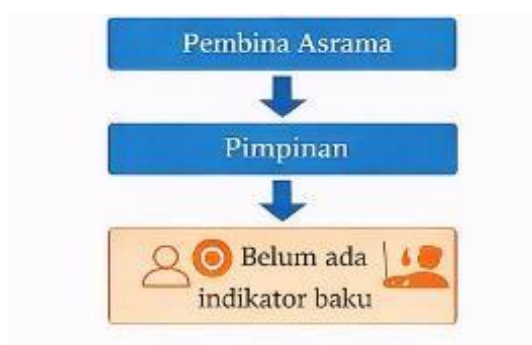
Gambar 5. Pengawasan

pengarahan, nasihat, dan pendampingan. Dengan demikian, pengawasan tidak hanya bersifat kontrol administratif, tetapi juga menjadi bagian dari proses pendidikan karakter.