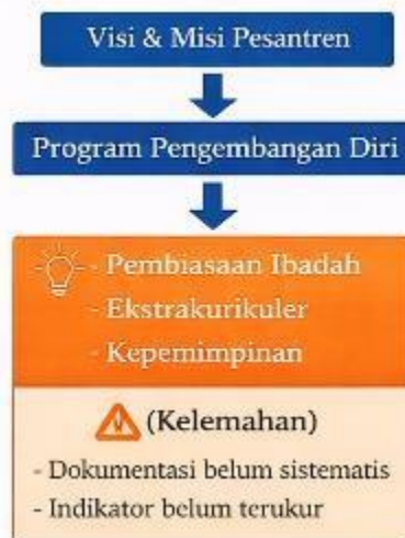
Gambar 2. Perencanaan Pengembangan Diri Santri

Perencanaan juga melibatkan unsur pimpinan pesantren, guru, dan pembina asrama. Keterlibatan berbagai unsur tersebut menunjukkan bahwa pengembangan diri santri tidak dirancang secara individual oleh satu pihak, tetapi melalui koordinasi kelembagaan. Meskipun demikian, hasil penelitian menemukan bahwa belum seluruh program memiliki indikator capaian karakter yang terdokumentasi secara rinci.