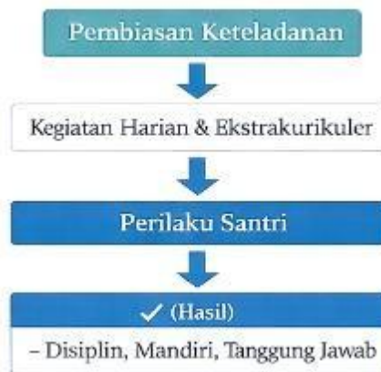
Gambar 4. Pelaksanaan Pengembangan Diri Santri

Pelaksanaan pengembangan diri santri tidak hanya berorientasi pada keterlibatan dalam kegiatan, tetapi juga pada pembentukan kebiasaan positif yang berlangsung secara berulang. Kegiatan harian di pesantren menjadi media utama dalam membentuk pola perilaku santri. Melalui rutinitas yang teratur, santri diarahkan untuk membangun kedisiplinan, tanggung jawab, kemandirian, dan kepedulian terhadap sesama.