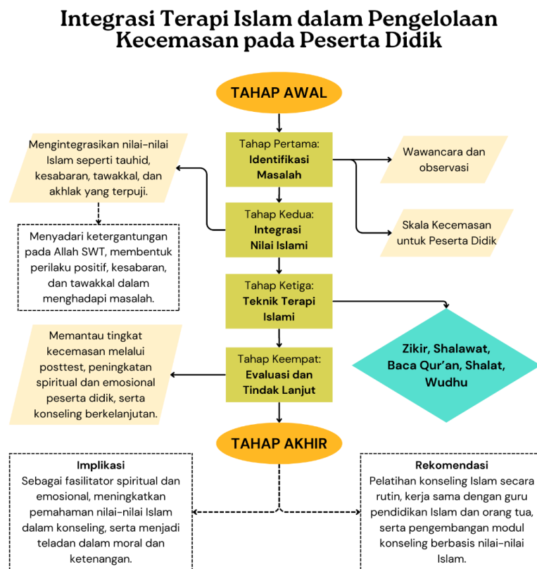
Gambar 2. Integrasi Terapi Islam dalam Pengelolaan Kecemasan pada Peserta Didik

Selain itu, penguatan kolaborasi antara keluarga, sekolah, dan masyarakat memiliki peran strategis dalam keberhasilan terapi Islami. Kampanye yang meningkatkan kesadaran dan pemahaman masyarakat tentang manfaat terapi Islami dapat mengangkat nilai terapi ini di mata publik sehingga mendapatkan dukungan luas (Annisa & Aziz, 2025). Keluarga sebagai unit utama pendidikan-peranan mereka dalam mendukung implementasi bimbingan konseling Islami harus diperkuat agar peserta didik mendapat pengawasan dan bimbingan sesuai ajaran Islam di lingkungan rumah. Partisipasi masyarakat secara aktif menciptakan lingkungan yang sehat, aman, dan Islami bagi peserta didik juga merupakan faktor krusial dalam menunjang keberhasilan terapi ini.