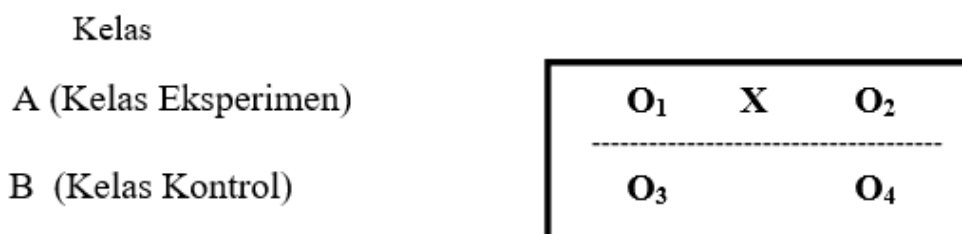
Gambar 1. Desain Quasi Experimental tipe Nonequivalent Control Group Design

Permainan yang dilakukan siswa, baik secara digital atau langsung selain berfungsi sebagai hiburan juga dapat membantu dalam proses kegiatan pembelajaran untuk mengembangkan pengetahuan, sikap, dan keterampilannya, hal ini didukung oleh pendapat Aristoteles (Hartati, Priambodo, & Kristiyandaru, 2013) bahwa sebaiknya anak dalam mempelajari sesuatu seharusnya didorong dengan berbagai kegiatan yang menyenangkan contohnya dengan bermain. Karena bermain merupakan suatu kebutuhan bagi siswa SD. Permainan tidak hanya menarik dan menyenangkan namun harus dikemas agar mampu merangsang pikiran anak untuk mengembangkan pengetahuan dan karakter pada siswa.