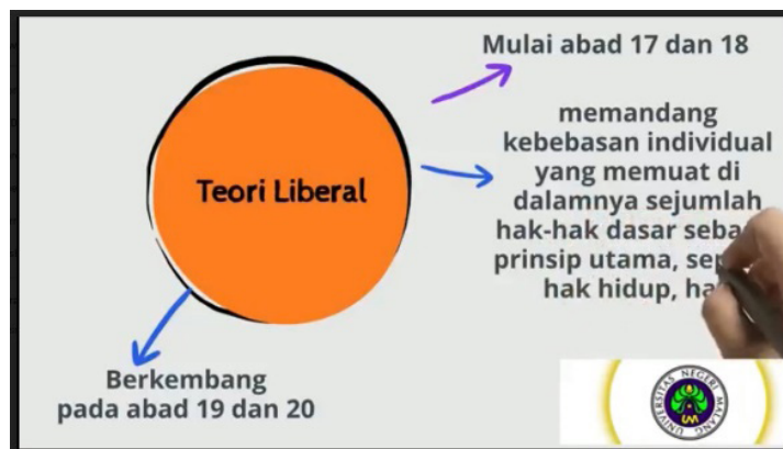
Gambar 1. Produk yang dikembangkan