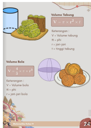
Gambar 1. Materi Volume Bangun Ruang Berbasis Kearifan Lokal Makanan Khas Daerah