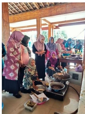
Gambar 3. Partisipasi Aktif dari Keraguan Pelaku Usaha untuk Mengikuti Pelatihan

Perempuan yang memulai bisnis awalnya ragu-ragu, tetapi kemudian berusaha memulainya karena kebutuhan mendesak. Karena suaminya diputus kerja, istri berusaha membantu ekonomi keluarga dengan membuat barang untuk dipasarkan dan menghasilkan uang. Seperti yang disampaikan oleh informan berikut, ada lagi perempuan pelaku usaha yang kuatir dengan resiko dan memulai usaha dengan bergabung dengan teman lain. Berdasarkan penjelasan informan di atas, diketahui bahwa ada perempuan pelaku usaha yang menjalankan usahanya dengan bekerja sama dengan teman-teman mereka untuk mengurangi resiko yang terkait dengan usaha atau bisnis mereka. Beberapa wanita yang berniat memulai bisnis masih ragu karena mereka tidak memiliki modal yang cukup. Dia percaya bahwa untuk memulai bisnis dibutuhkan modal yang cukup, terutama modal keuangan. Temuan tersebut menunjukkan bahwa beberapa perempuan ragu untuk memulai bisnis setelah menikah. Perempuan yang dulu pernah berproduksi dan produktif masih mengalami keraguan. Perempuan sering menolak kesempatan karena ragu-ragu atau karena orang lain meragukan kemampuan mereka, gambar 3 menunjukkan hal tersebut.