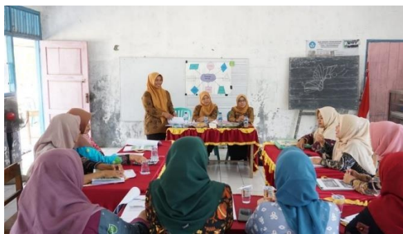
Gambar 2. Kegiatan PKK dalam Melakukan Pendampingan UMKM

Berdasarkan temuan tersebut, pendamping telah membantu perempuan pelaku usaha bekerja sama dengan berbagai organisasi, baik pemerintah maupun swasta. Tujuan dari kerjasama dengan semua pihak adalah untuk mencapai keuntungan bagi masing-masing pihak. Diharapkan bahwa kerjasama ini akan membantu bisnis mereka berkembang. Diharapkan bahwa pendampingan ini akan membantu para perempuan pelaku usaha menghasilkan lebih banyak uang. Para perempuan usahawan akan terus berinovasi untuk meningkatkan kualitas produk bersama dengan pendamping mereka, tetapi di setiap langkah mereka pasti akan menghadapi berbagai masalah. Dalam program pendampingan mereka, para pelaku usaha dan pendamping akan memiliki kemampuan untuk menemukan dan menangani masalah yang dihadapi oleh setiap pelaku usaha. Hal ini terlihat pada gambar 2.