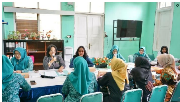
Gambar 4. Transformative Learning Untuk Mengubah Pola Pikir Masyarakat

Hasil lain dilakukan untuk mendapatkan informasi lebih lanjut tentang cara penerapan pendekatan pembelajaran transformatif sebagai upaya pemberdayaan masyarakat melalui program UP2K di Kabupaten Blora, peneliti melakukan triangulasi dengan data berikut: