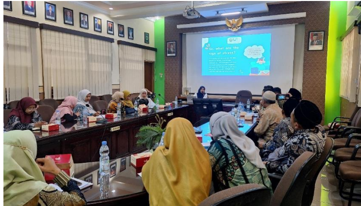
Gambar 3. Pelatihan Konseling CBT dengan MGBK MTs Kota Malang