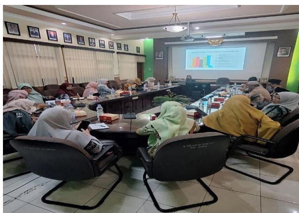
Gambar 2. Pelatihan Manajemen Stres dengan MGBK MTs Kota Malang

Pelatihan Stress Management diimplementasikan melalui pendekatan pembelajaran berbasis proyek ( Project Based Learning atau PjBL). Pendekatan ini menuntut partisipasi aktif dari peserta dalam mengeksplorasi secara mendalam topik tertentu, dengan fokus pada pembuatan proyek yang bertujuan untuk menawarkan solusi praktis terhadap masalah yang ada, dalam konteks ini, tujuan utama adalah menciptakan sebuah program bimbingan sebaya yang efektif sebagai jawaban atas tantangan yang dihadapi siswa. PjBL menyoroti pentingnya hasil yang tidak hanya teoritis, tetapi juga aplikatif dan langsung relevan dalam mengatasi kebutuhan nyata, khususnya dalam pengembangan program konseling sebaya untuk mengelola isu-isu siswa. Kegiatan ini dilakukan pada tanggal 31 Juli 2024. Dokumentasi Kegiatan sebagai berikut: