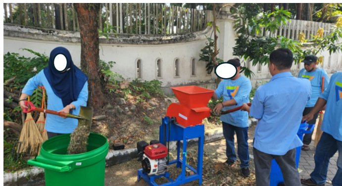
Gambar 2. Giat Jum'at Bersih Fakultas Vokasi didukung oleh Mesin Pencacah Sampah

Mesin pencacah yang telah diserahkan kepada pihak Fakultas Vokasi diuji coba dalam kegiatan Jum'at Bersih yang melibatkan tenaga kependidikan dan warga fakultas. Uji coba ini menunjukkan bahwa mesin mampu menghancurkan daun-daun kering dalam jumlah besar dengan waktu yang relatif singkat. Sampah daun yang semula hanya ditumpuk kini dapat langsung diproses menjadi potongan kecil yang siap diolah lebih lanjut menjadi kompos. Gambar 2 menunjukkan proses penggunaan mesin pencacah sampah di Fakultas Vokasi.