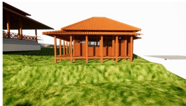
Gambar 5. Desain 3 Dimensi Bangunan Musala

Pada tahap selanjutnya yaitu finalisasi desain. Dalam tahap ini yaitu melakukan desain Musala sesuai saran yang didapatkan waktu pemaparan ke Desa Mulyoarjo. Di dalam finalisasi desain akan ada desain 3 dimensi yang disajikan pada Gambar 5 dan desain 2 Dimensi yang disajikan pada Gambar 6. Desain tersebut sudah sesuai dengan yang diinginkan oleh Desa Mulyoarjo.