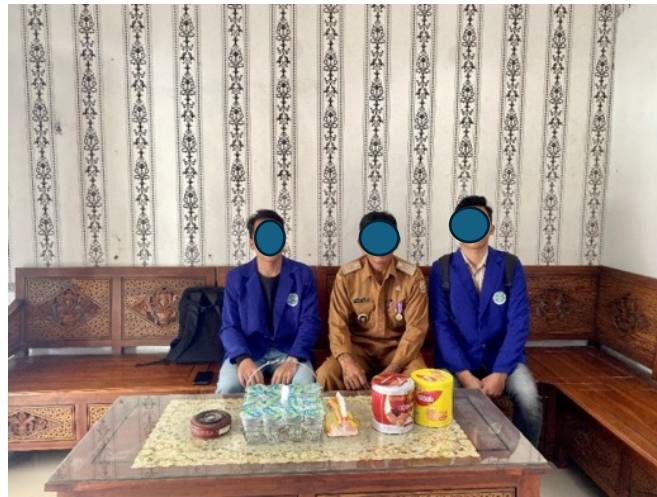
Gambar 4. Pemaparan Desain kepada Pihak Desa Mulyoarjo

Pada tahap selanjutnya yaitu finalisasi desain. Dalam tahap ini yaitu melakukan desain Musala sesuai saran yang didapatkan waktu pemaparan ke Desa Mulyoarjo. Di dalam finalisasi desain akan ada desain 3 dimensi yang disajikan pada Gambar 5 dan desain 2 Dimensi yang disajikan pada Gambar 6. Desain tersebut sudah sesuai dengan yang diinginkan oleh Desa Mulyoarjo.