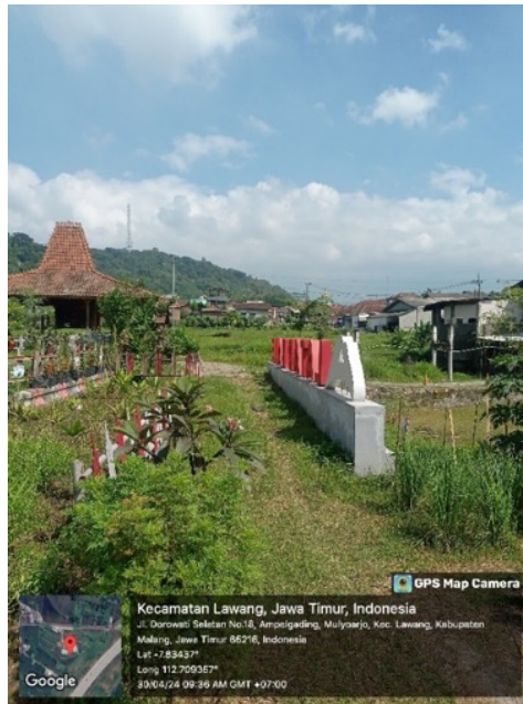
Gambar 2. Survei Lapangan dan Pengumpulan Data