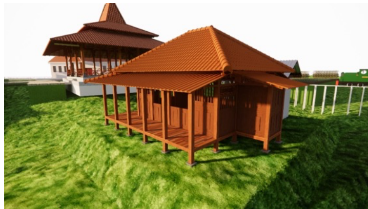
Gambar 3. Desain Rencana Pemodelan Bangunan Musala

Tahap Pelaksanaan dalam kegiatan Desain Musala di kawasan wisata Latar Bale melibatkan beberapa tahapan. Pada tahap pertama yaitu pembuatan desain rencana pemodelan bangunan Musala seperti pada Gambar 3. Pembuatan desain ini dilakukan dengan cara membuat gambar dalam bentuk 3D yang dibuat berdasarkan survei yang telah didapatkan dari tahap sebelumnya. Pembuatan desain ini menggunakan beberapa software desain seperti Sketchup, Enscape, dan Lumion.