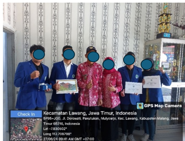
Gambar 8. Penyerahan Desain dan Rencana Anggaran Biaya (RAB) Bangunan Musala

Evaluasi pelaksanaan kegiatan menunjukkan bahwa proses perencanaan dan pelaksanaan telah berjalan sesuai dengan tujuan. Desain Musala yang dibuat dapat memenuhi kebutuhan wisatawan dan mendukung pengembangan Wisata Latar Bale yang ada di Desa Mulyoarjo. Desain akhir dan perencanaan anggaran yang telah disusun memastikan bahwa pembangunan Musala dapat dilakukan secara efisien, meningkatkan kualitas fasilitas wisata di kawasan tersebut dan memberikan manfaat jangka panjang bagi pengunjung dan masyarakat lokal.