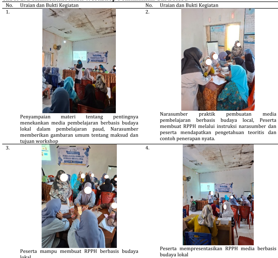
Tabel 1. Dokumentasi Hasil Workshop Pemahaman Guru PAUD

Kreativitas guru dalam mengembangkan media pembelajaran berbasis budaya lokal menjadi salah satu dampak positif workshop . Guru tidak hanya mengikuti instruksi, tetapi mampu mengombinasikan ide-ide budaya dengan teknik pembuatan media secara inovatif menggunakan bahan alam sekitar. Hasil karya media pembelajaran yang dipamerkan menunjukkan variasi bentuk dan fungsi seperti alat peraga, permainan edukatif, dan media visual yang menarik. Kemampuan guru untuk berkolaborasi dan berinovasi meningkat secara signifikan, menciptakan proses pembelajaran yang lebih interaktif dan bermakna bagi anak usia dini di Kecamatan Sanrobone. Berikut Tabel 1 menunjukkan dokumentasi hasil workshop pemahaman guru PAUD.