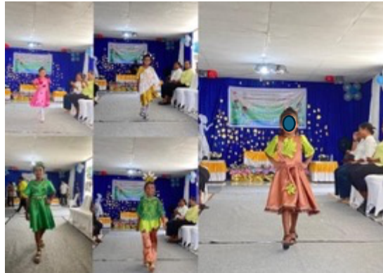
Gambar 4. Fashion Show