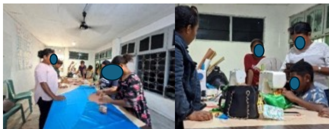
Gambar 2. Proses Pemotongan Pola di Kain dan Menjahit Busana

Peserta juga diberikan pelatihan intensif dalam mengoperasikan mesin jahit serta pembuatan pola busana. Aktivitas ini secara langsung meningkatkan keterampilan teknis mereka dan membangun rasa percaya diri dalam menghasilkan karya yang berkualitas. Keterampilan teknis dalam penggunaan mesin jahit dan pembuatan pola busana mempengaruhi langsung kualitas produk dan meningkatkan self-efficacy peserta (Astuti, 2023).