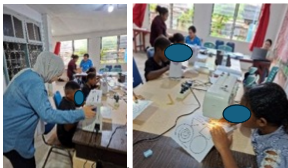
Gambar 1. Proses Peningkatan Kemampuan Peserta dalam Mengoperasikan Mesin Jahit dengan Memakai Pola-Pola Bentuk Dasar

Pelaksanaan pembelajaran dimulai dengan identifikasi peserta melalui survei dan wawancara untuk memastikan adanya minat serta potensi yang relevan. Ini sejalan dengan praktik pembelajaran keterampilan yang efektif pada pelatihan keterampilan menjahit, di mana fase awal meliputi perencanaan, pengenalan dasar kegiatan, serta pemetaan kemampuan peserta agar strategi pembelajaran dapat disusun secara sistematis sesuai kebutuhan (KaU, 2011).