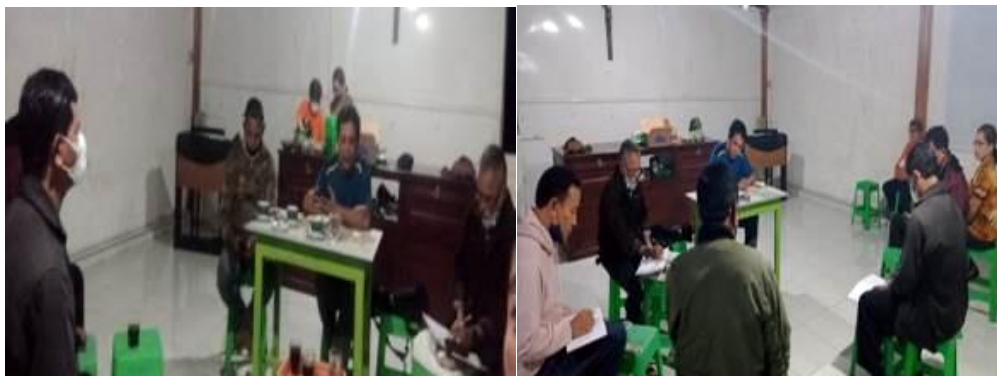
Gambar 3. Evaluasi Bersama

Selain itu menurut Clark (1963); Naim (2016), kegiatan pemberdayaan kesadaran hidup toleransi beragama di kalangan umat/masyarakat sangat diperlukan untuk membentuk kematangan hidup beragama yang ditunjukkan dalam beberapa karakteristik berikut. a) Memiliki karakter baik dengan wawasan keagamaan secara luas. (2) Bersikap bijaksana dalam menerima kritik tanpa menimbulkan konflik. (3) Memiliki komitmen beragama dan berinteraksi sosiol-religius secara terbuka. (4) Membangun pendekatan terbuka berbasis nilai-nilai humanis beragama dalam keharmonisan hidup bersama; (5) Memiliki kematangan perilaku beragama dalam penghayatan hidup sehari-hari. (6) Menggunakan pendekatan komprehensif berbasis semangat toleransi. (7) Mencari dan menemukan kebaikan dan kebenaran dalam konsep berpikir positif yang jernih (Amalia & Nanuru, 2018).