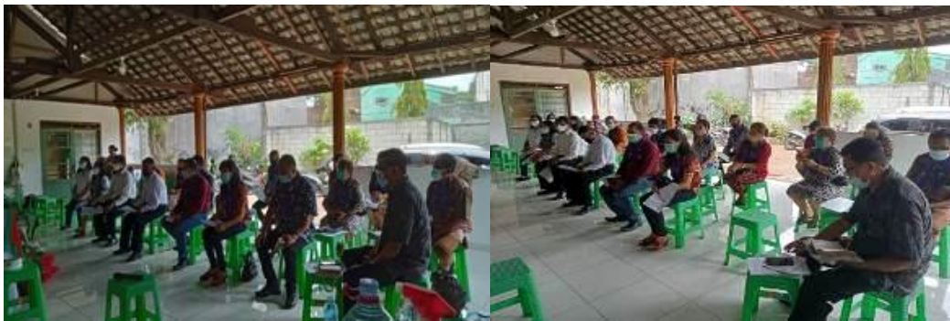
Gambar 2. Penyajian Materi (Ceramah) dalam Kelompok

Hasil kegiatan pemberdayaan kehidupan toleransi beragama ini dimana para peserta memiliki pengetahuan dan pemahaman akan pentingnya hidup rukun dan damai dalam masyarakat yang multikultural. Selain itu para peserta mampu memaknai perbedaan sebagai kekayaan dan keunikan yang perlu dilestarikan dalam kehidupan berbangsa dan bernegara demi menjaga keutuhan dan kesatuan Negara Republik Indonesia. Antusiasisme para peserta mengikuti ceramah dibuktikan dengan partisipasi aktif dalam sesi tanya jawab dan diskusi bersama. Melalui dialog dan tanya jawab memicu para peserta untuk menggali dan memahami lebih luas akan pentingnya hidup rukun dan damai dalam kehidupan masyarakat yang multikultural. Pada sesi dialog atau shering persaudaraan, para peserta saling berbagi pengalaman nyata kehidupan yang toleran, sehingga memperkaya peserta lain dalam memaknai kehidupan toleransi di lingkungan hidupnya. Selanjutnya pada sesi kegiatan aksi nyata, ditemukan berbagai variasi pengalaman dalam kegiatan yang menggambarkan adanya peluang dan tantangan dalam membangun budaya toleransi di tengah masyarakat. Karena itu diperlukan rekomendasi dan panduan bersama untuk mengantisipasi memudarnya semangat hidup toleran, dan terus mengembangkan dan menghidupkan semangat toleransi yang telah bertumbuh dengan baik di tengah masyarakat yang multikultural.