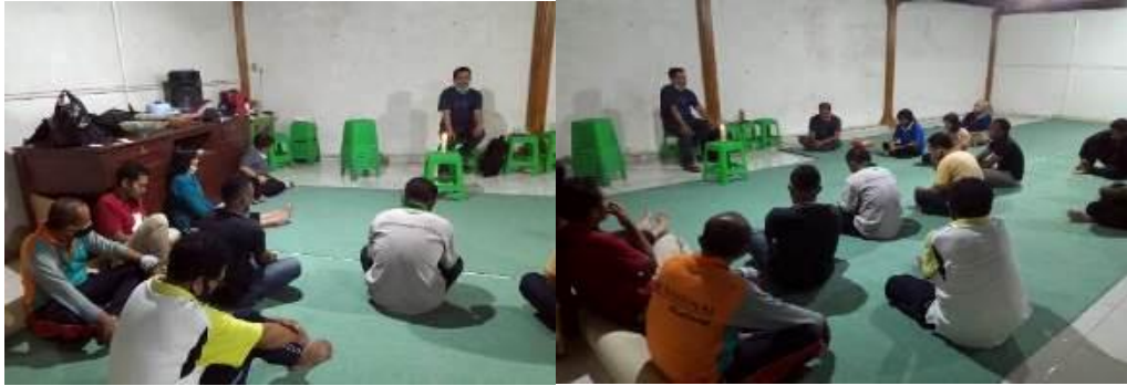
Gambar 3. Diskusi/Shering Persaudaraan

Selain itu menurut Clark (1963); Naim (2016), kegiatan pemberdayaan kesadaran hidup toleransi beragama di kalangan umat/masyarakat sangat diperlukan untuk membentuk kematangan hidup beragama yang ditunjukkan dalam beberapa karakteristik berikut. a) Memiliki karakter baik dengan wawasan keagamaan secara luas. (2) Bersikap bijaksana dalam menerima kritik tanpa menimbulkan konflik. (3) Memiliki komitmen beragama dan berinteraksi sosiol-religius secara terbuka. (4) Membangun pendekatan terbuka berbasis nilai-nilai humanis beragama dalam keharmonisan hidup bersama; (5) Memiliki kematangan perilaku beragama dalam penghayatan hidup sehari-hari. (6) Menggunakan pendekatan komprehensif berbasis semangat toleransi. (7) Mencari dan menemukan kebaikan dan kebenaran dalam konsep berpikir positif yang jernih (Amalia & Nanuru, 2018).