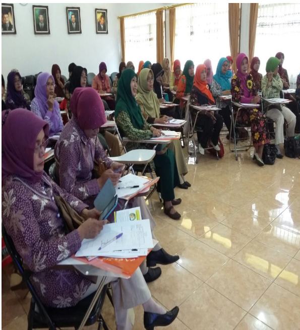
Gambar 4. Antusiasme Peserta dalam Mengikuti Kegiatan