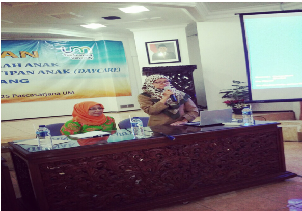
Gambar 3. Proses Pembukaan Pelatihan yang dipimpin oleh Ketua Tim