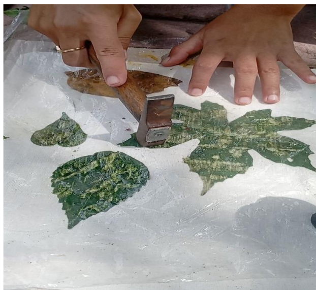
Gambar 3. Proses Pembuatan Batik Ecoprint

pemecahan masalah yang efektif. Proses tersebut tidak hanya melibatkan pengetahuan ilmiah, tetapi juga kemampuan untuk merancang dan menganalisis yang merupakan sebuah inti dari kegiatan pemecahan masalah. Berikut adalah gambar Batik Ecoprint diproses.