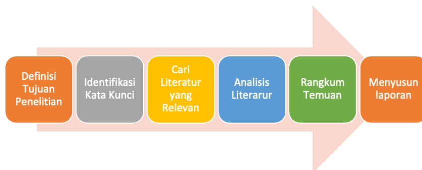
Gambar 1. Metode Studi Literatur