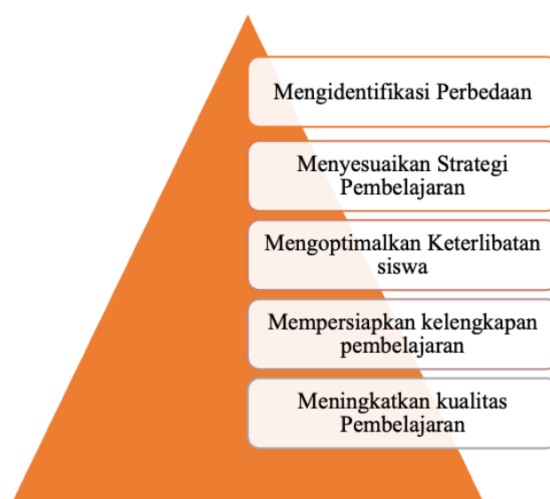
Gambar 3. Penerapan Pembelajaran Berdiferensiasi